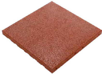
Die Oberseite der Fallschutzplatte FX

Die Fallschutzplatten FX werden automatisch produziert und eignen sich für die Verwendung auf Spielplätzen. Die Platten werden versetzt mit Steckverbindern (acht Löcher auf zwei Seiten) verlegt. Die Drainage der Platten eignet sich für besonders niederschlagsreiche Regionen und feste Flächen, bei denen das Wasser nicht versickern kann.